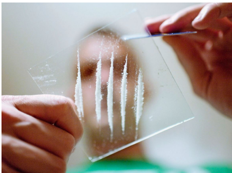
«Der Puls rast, der Blutdruck ist hoch, man ist extrem aufgeregt»: Kokain ist auch in der Schweiz zur Massenware geworden