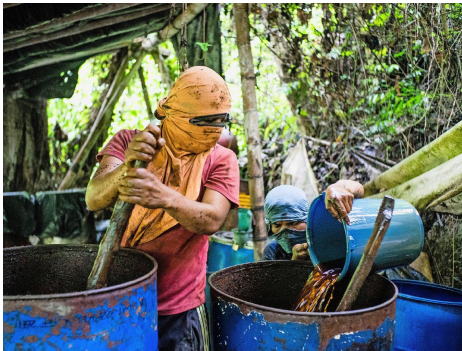
Allein in Kolumbien hat sich die Anbaufläche in den letzten acht Jahren vervierfacht: Kokainherstellung in der Nähe von Cali

Fedpol räumt auf Anfrage zwar ein, dass es seine Prioritäten in den letzten Jahren neu ausgerichtet hat. Doch man habe den Kampf gegen Drogenkriminalität keineswegs aufgegeben. «Die ehemals als Kommissariat Betäubungsmittel bekannte Abteilung ist nicht aufgelöst worden», sagt Sprecher Thomas Dayer. Sie habe ihren Zuständigkeitsbereich auf die organisierte und schwere Kriminalität ausgedehnt. Zwei ihrer Polizeidienststellen kümmern sich weiterhin um «die meisten Fälle im Zusammenhang mit dem Drogenhandel».